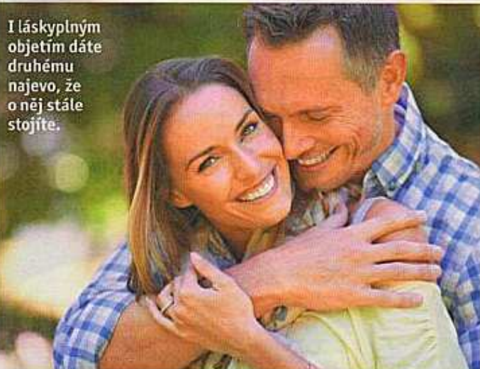
I láskyplným objetím dáte druhému najevo, že o něj stále stojíte.

lidé v manželství nebo dlouholetém partnerství se postupně přestanou starat o zevnějšek. Nejde o to vypadat jako ve dvaceti, ale když si budete udržovat postavu a občas si koupíte něco hezkého na sebe, budete si připadat skvěle a přitažlivě. A pokud se tak budete cítit vy, odrazí se to i pocitech vašeho partnera.